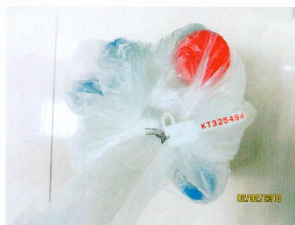
Mẫu nước được niêm phong