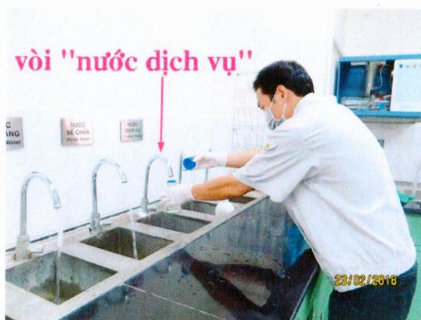
Vị trí lấy mẫu