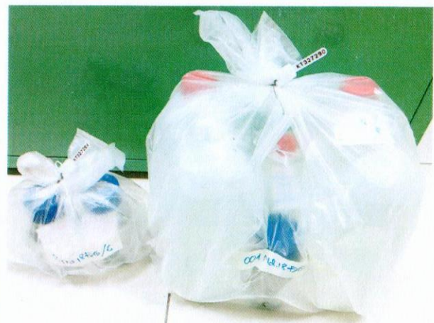
Mẫu nước được niêm phong