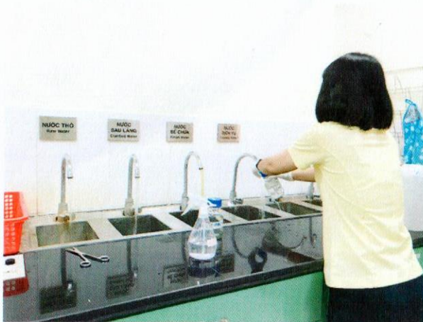
Lấy mẫu nước