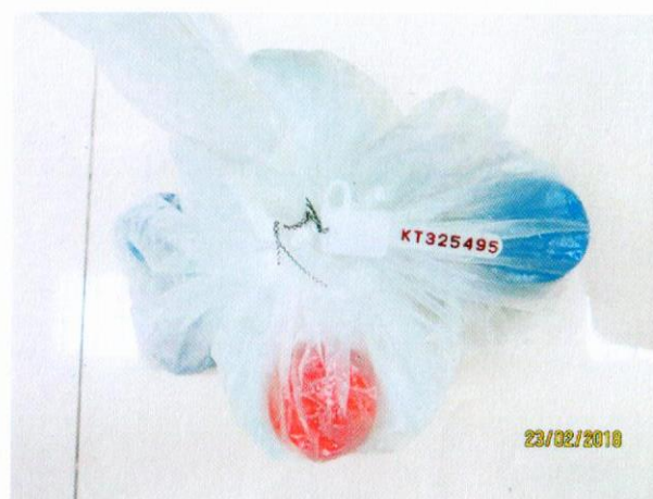
Mẫu nước được niêm phong