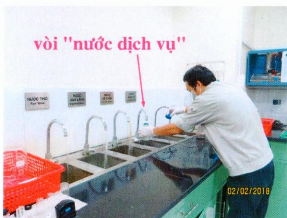
Lấy mẫu nước