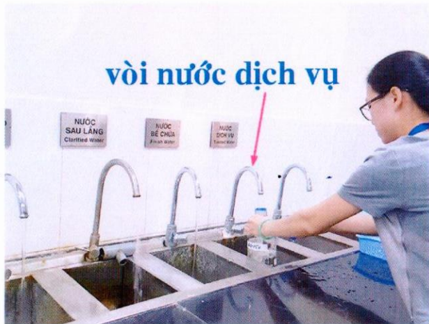
Lấy mẫu nước