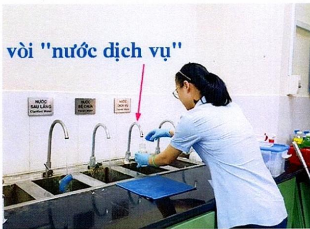
Vị trí lấy mẫu