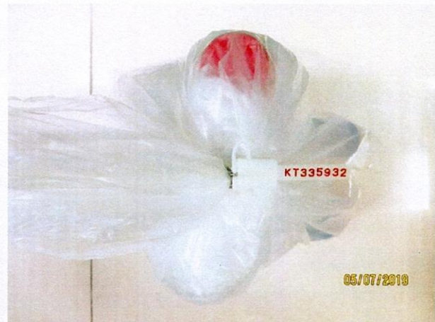
Mẫu nước được niêm phong