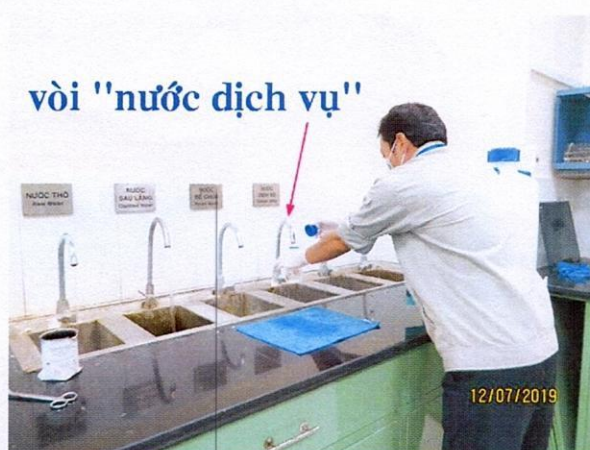
Lấy mẫu nước