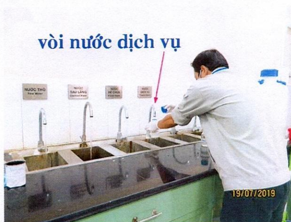
Lấy mẫu nước