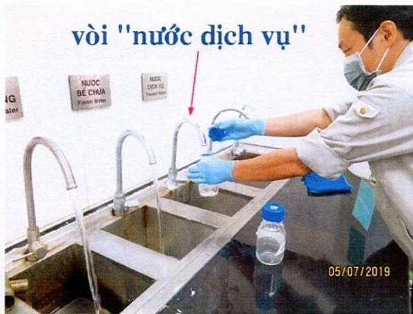
Lấy mẫu nước