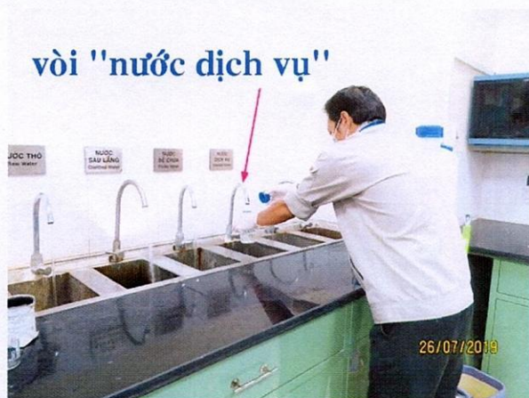
Vị trí lấy mẫu