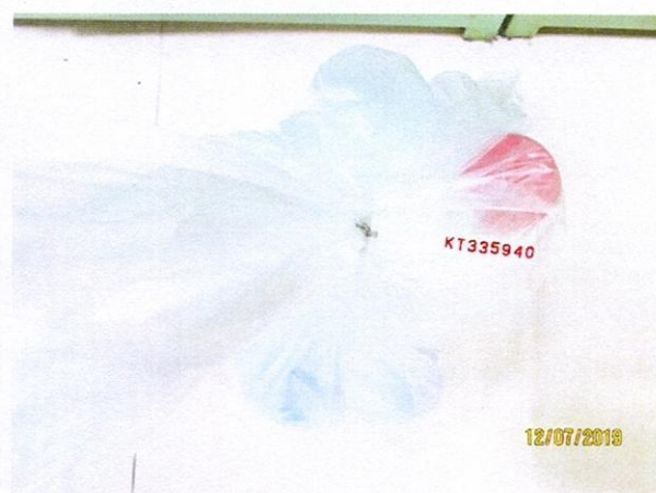
Mẫu nước được niêm phong