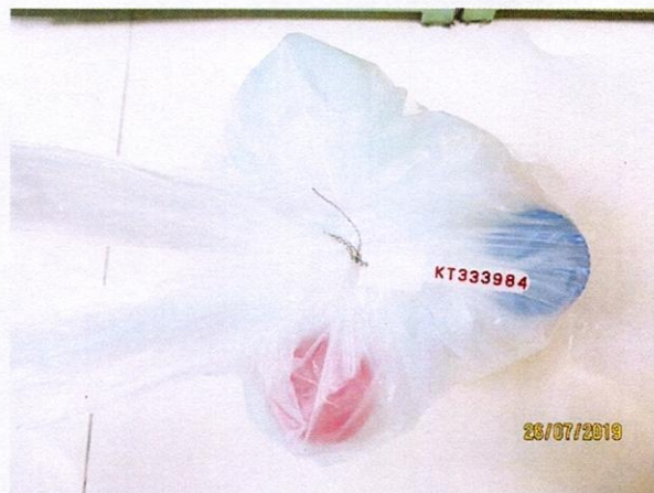
Mẫu nước được niêm phong