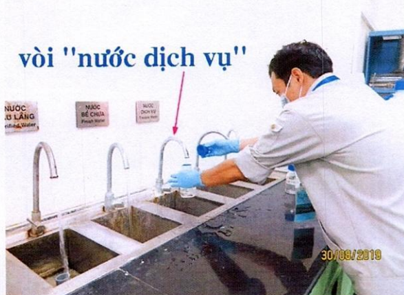
Vị trí lấy mẫu