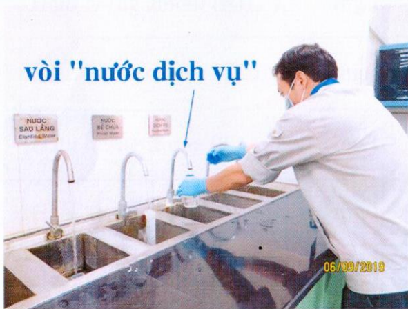
Lấy mẫu nước