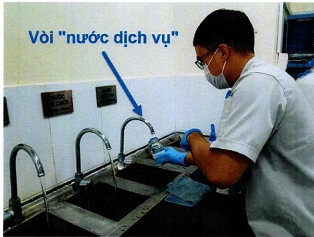
Vị trí lấy mẫu