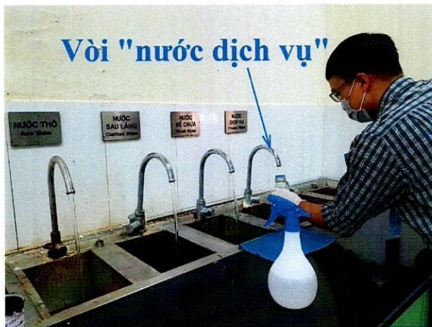
Lấy mẫu nước