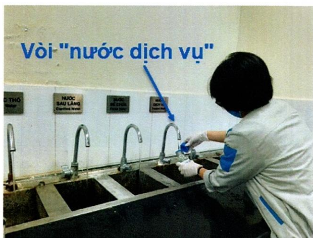
Vị trí lấy mẫu nước