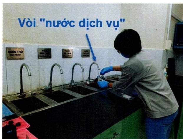
Vị trí lấy mẫu nước