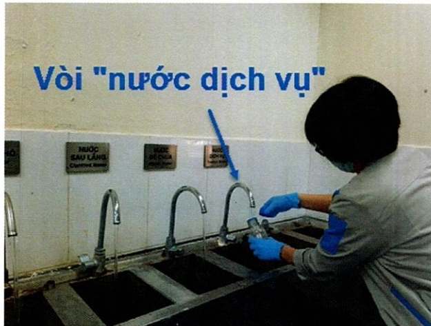
Vị trí lấy mẫu nước