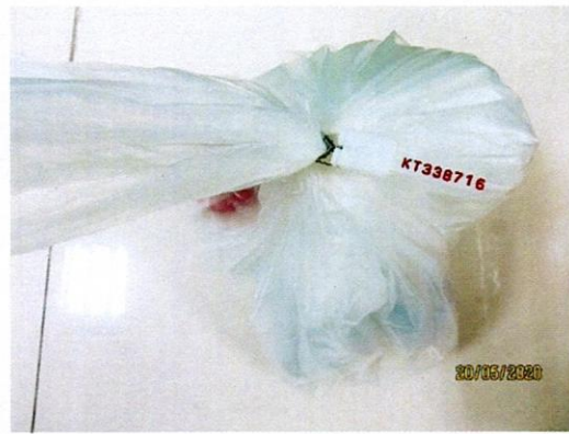
Mẫu nước được niêm phong