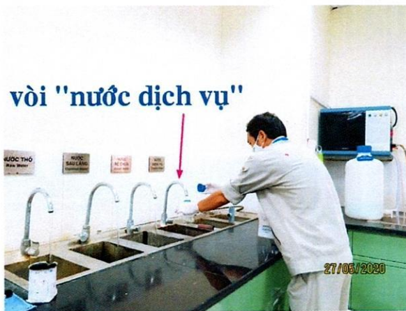
Vị trí lấy mẫu