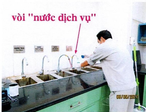
Vị trí lấy mẫu nước