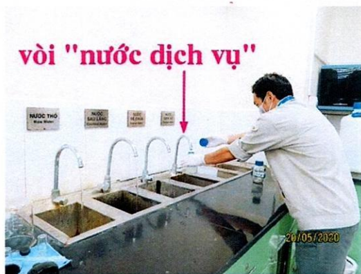
Vị trí lấy mẫu nước