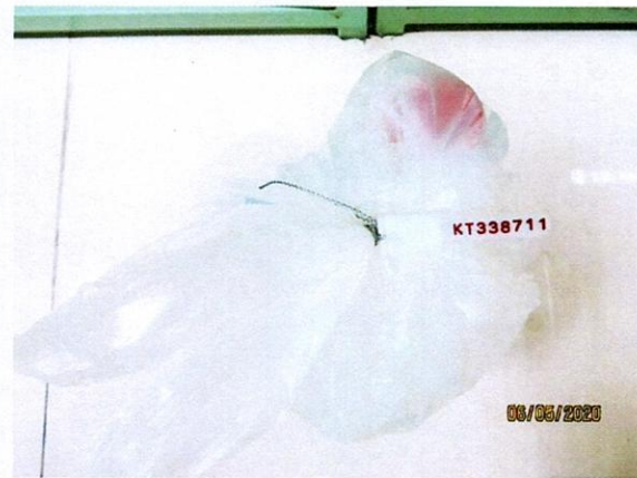
Mẫu nước được niêm phong