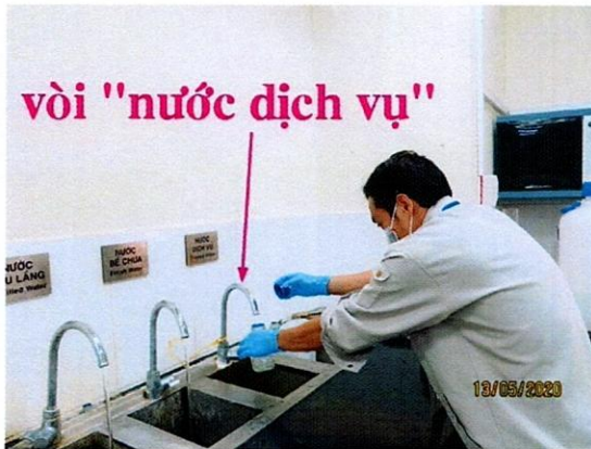
Vị trí lấy mẫu nước