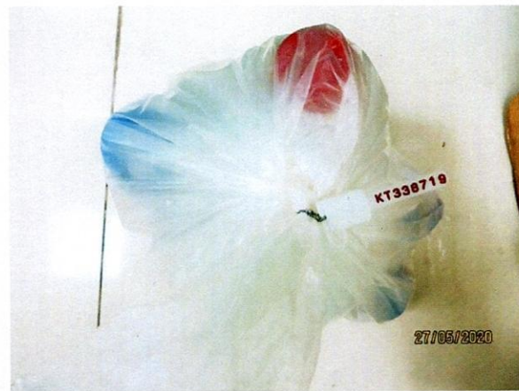
Mẫu nước được niêm phong