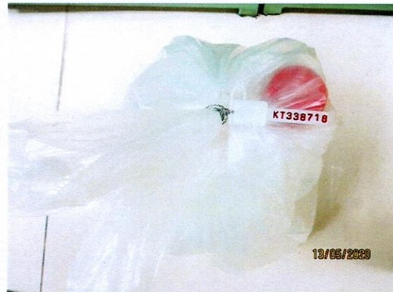
Mẫu nước được niêm phong