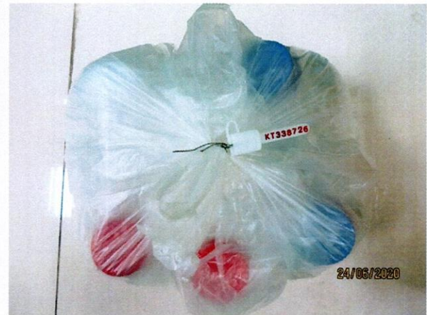
Mẫu nước được niêm phong