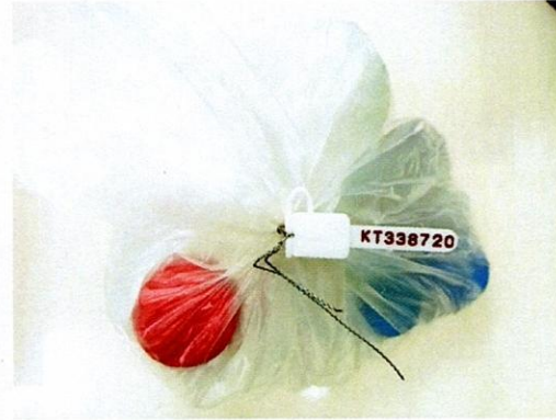
Mẫu nước được niêm phong

TRUNG TÂM KỸ THUẬT 3 KIỂM ĐỊNH CHẤT LƯỢNG AN ĐỘ LƯỢNG