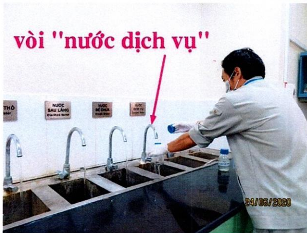
Vị trí lấy mẫu nước