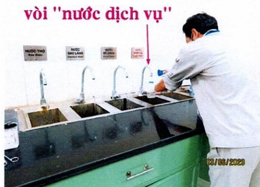
Vị trí lấy mẫu nước