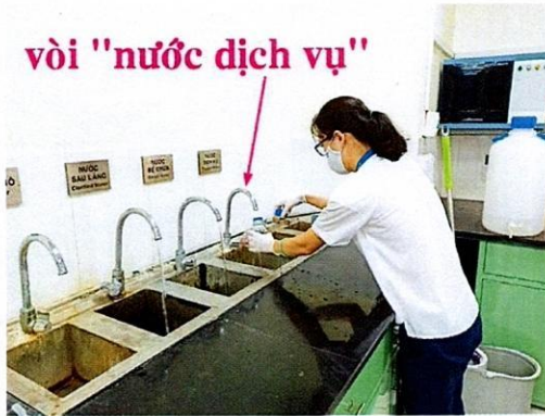
Vị trí lấy mẫu nước