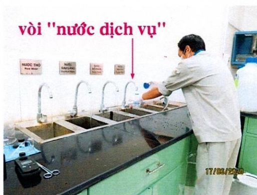
Vị trí lấy mẫu nước