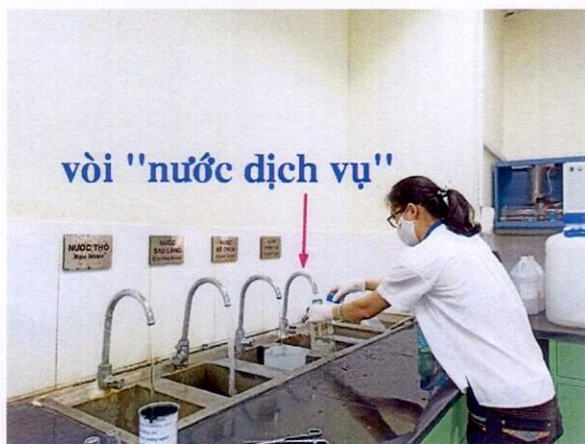
Vị trí lấy mẫu