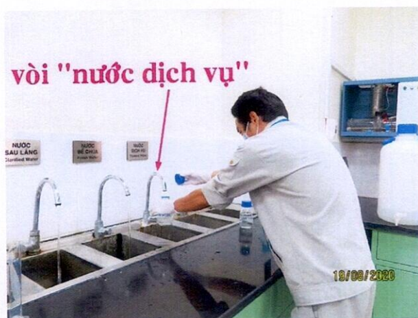
Vị trí lấy mẫu nước