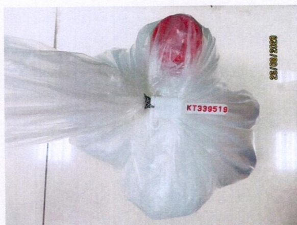
Mẫu nước được niêm phong