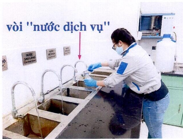
Vị trí lấy mẫu nước