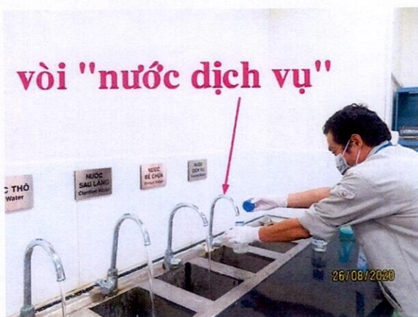
Vị trí lấy mẫu