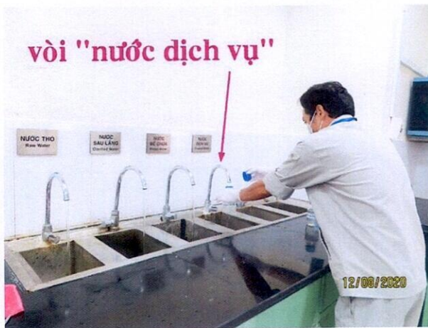
Vị trí lấy mẫu nước