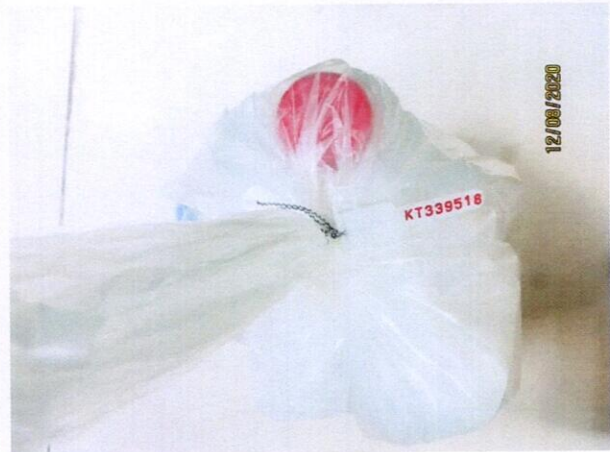
Mẫu nước được niêm phong