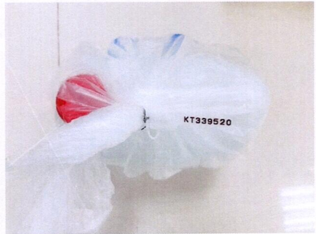
Mẫu nước được niêm phong