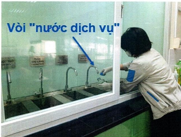
Vị trí lấy mẫu