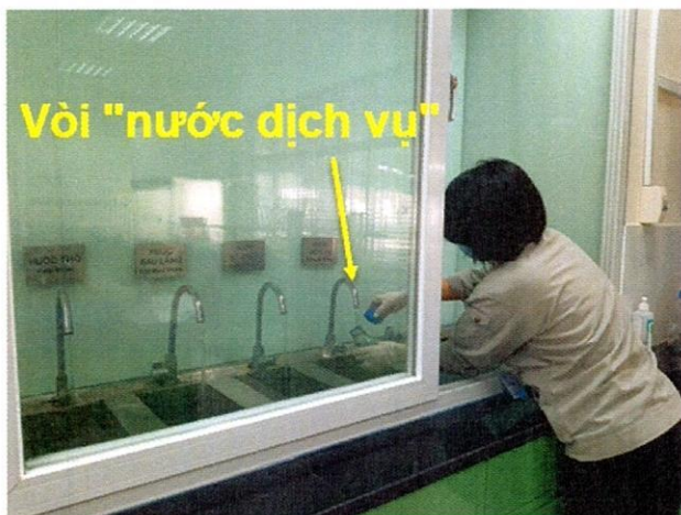
Vị trí lấy mẫu