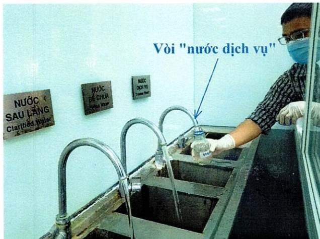
Vị trí lấy mẫu nước