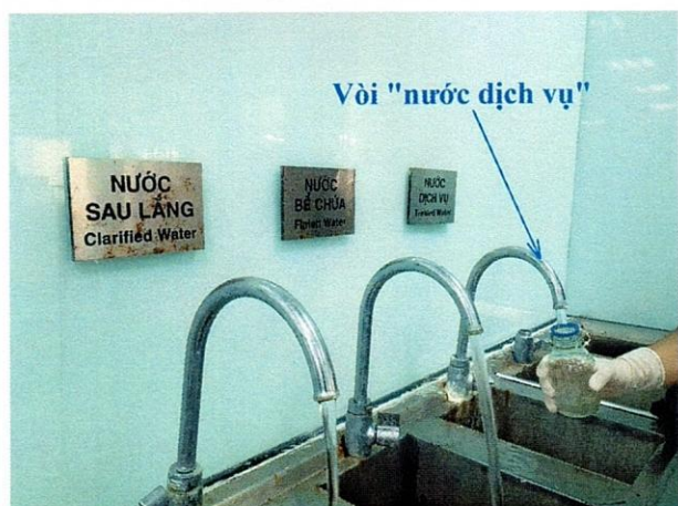
Vị trí lấy mẫu