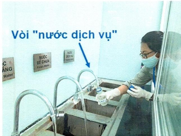
Vị trí lấy mẫu nước