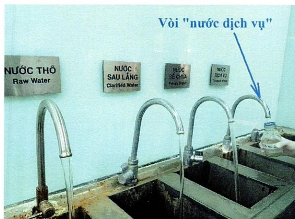
Vị trí lấy mẫu nước