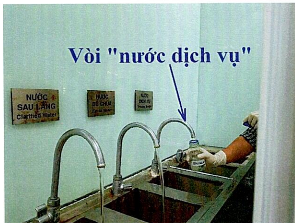
Vị trí lấy mẫu