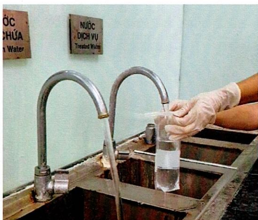
Vị trí lấy mẫu