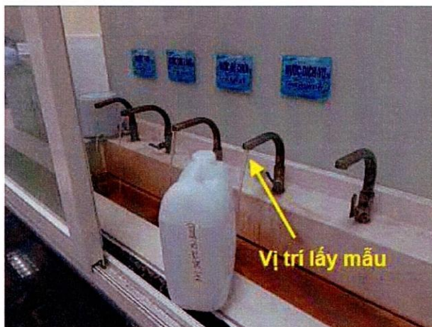
Vị trí lấy mẫu nước