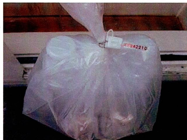
Mẫu nước được niêm phong