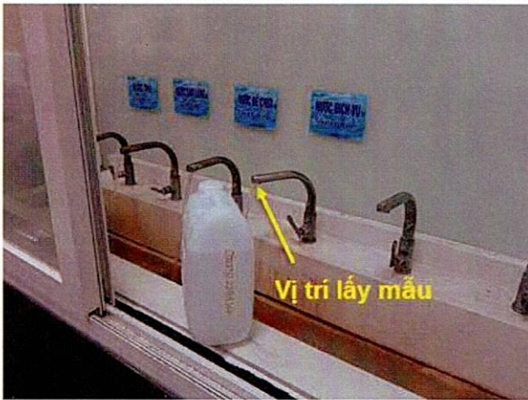
Vị trí lấy mẫu nước