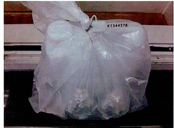
Mẫu nước được niêm phong

C VÀ CỐ NG TÂM I ĐỀU CH LƯỢNG LƯỢNG Y ĐO LƯỜNG