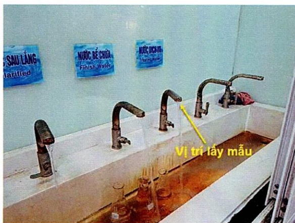
Vị trí lấy mẫu nước