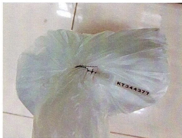
Mẫu nước được niêm phong