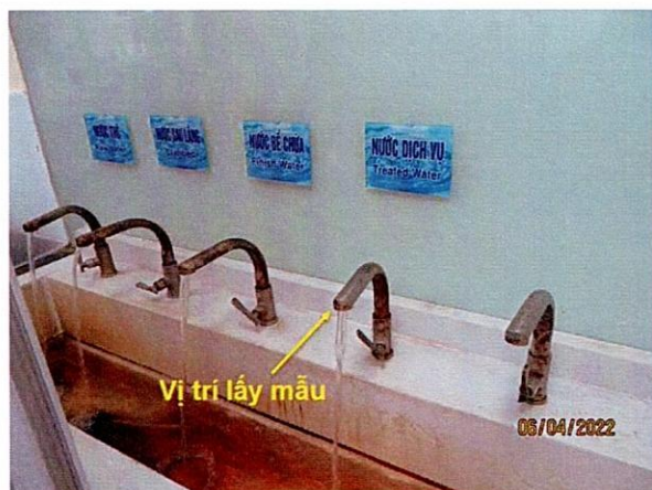
Vị trí lấy mẫu nước