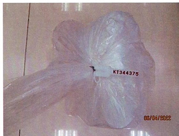
Mẫu nước được niêm phong