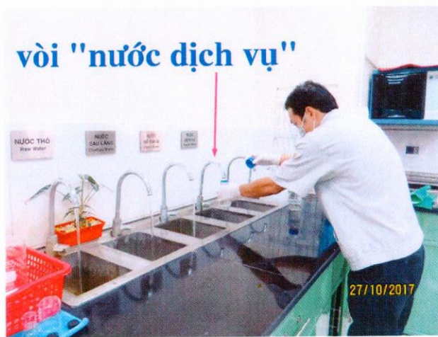
Vị trí lấy mẫu