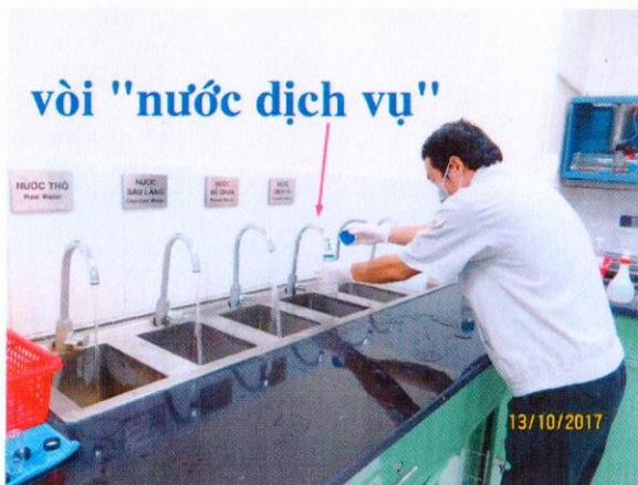
Lấy mẫu nước