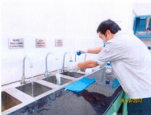
Lấy mẫu nước