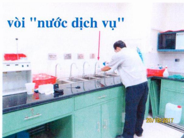
Lấy mẫu nước