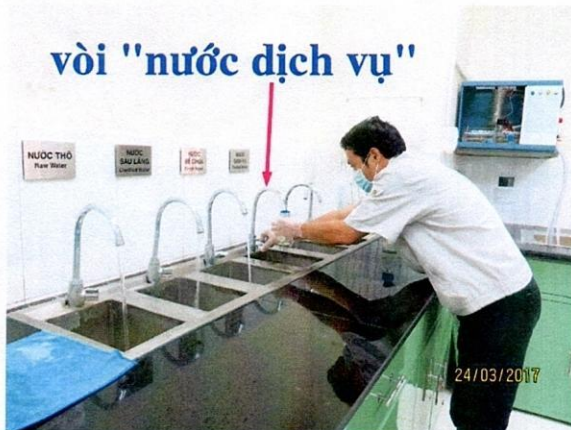
Lấy mẫu nước