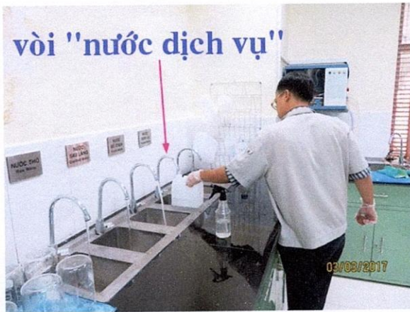
Lấy mẫu nước