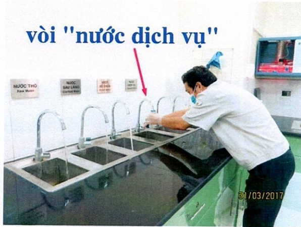
Vị trí lấy mẫu nước cấp