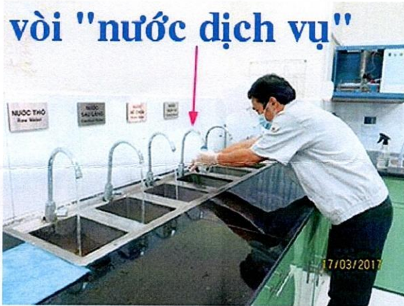
Lấy mẫu nước