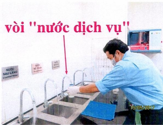
Lấy mẫu nước