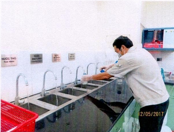
Lấy mẫu nước