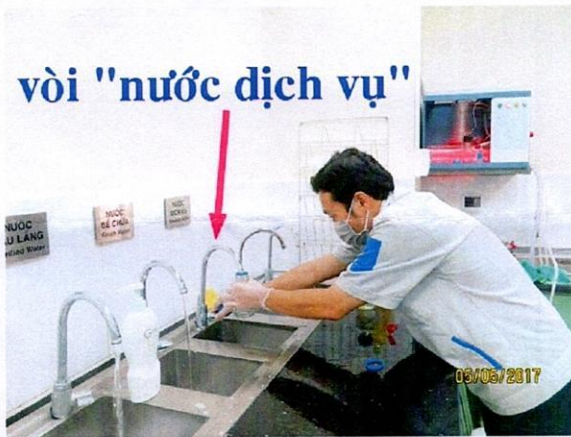
Lấy mẫu nước