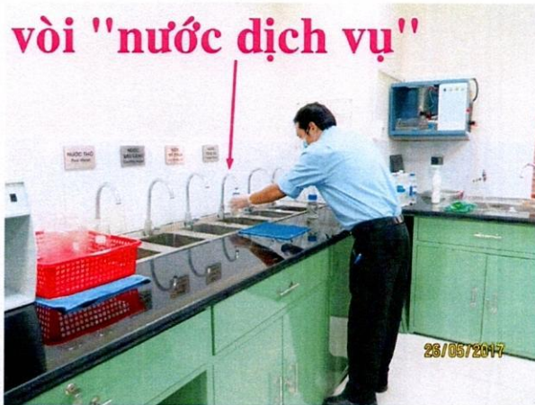
Vị trí lấy mẫu