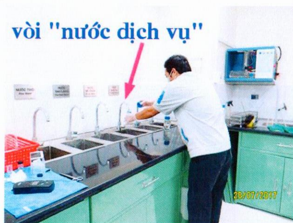
Vị trí lấy mẫu