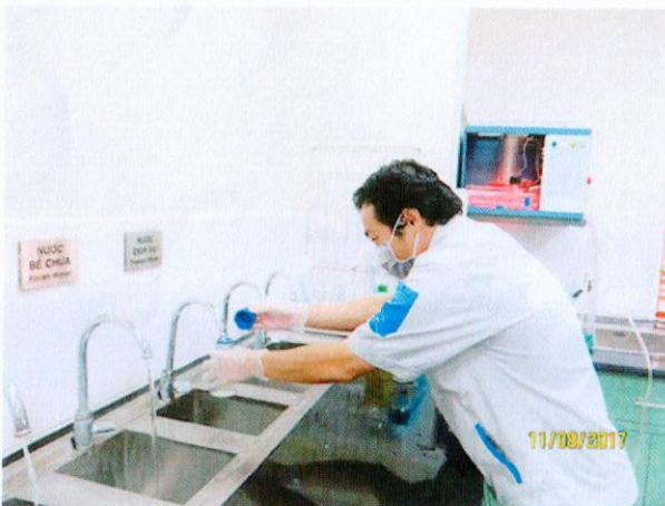
Lấy mẫu nước