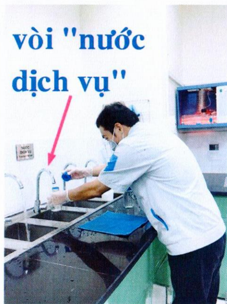
Vị trí lấy mẫu