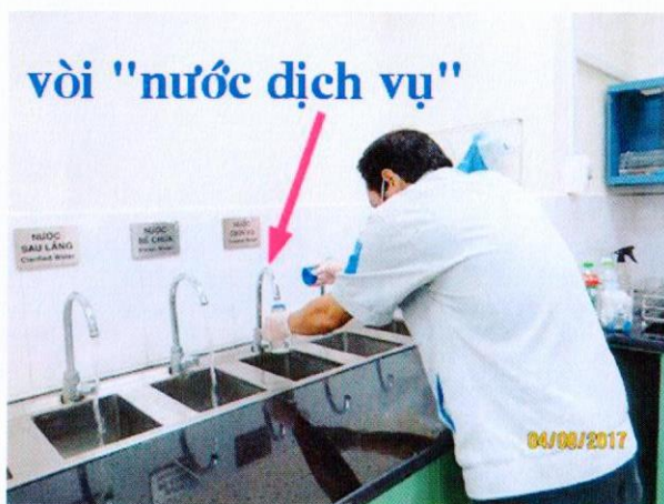
Lấy mẫu nước