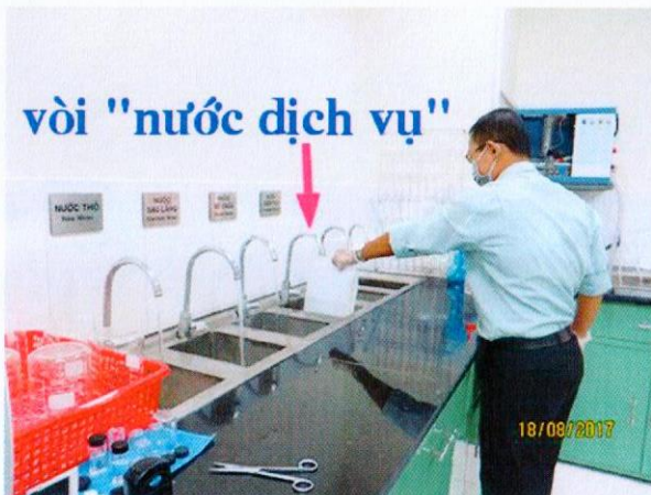
Lấy mẫu nước